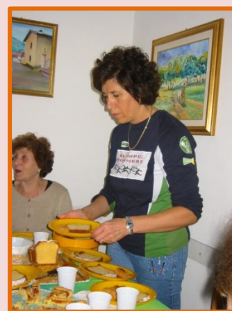
Bisogna pensare anche allo stomaco !!