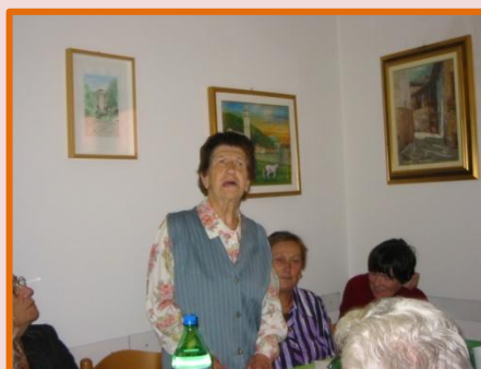
le Poesie di Gertrude