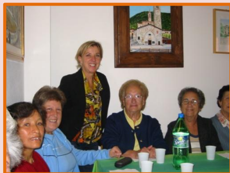
Foto con il sindaco